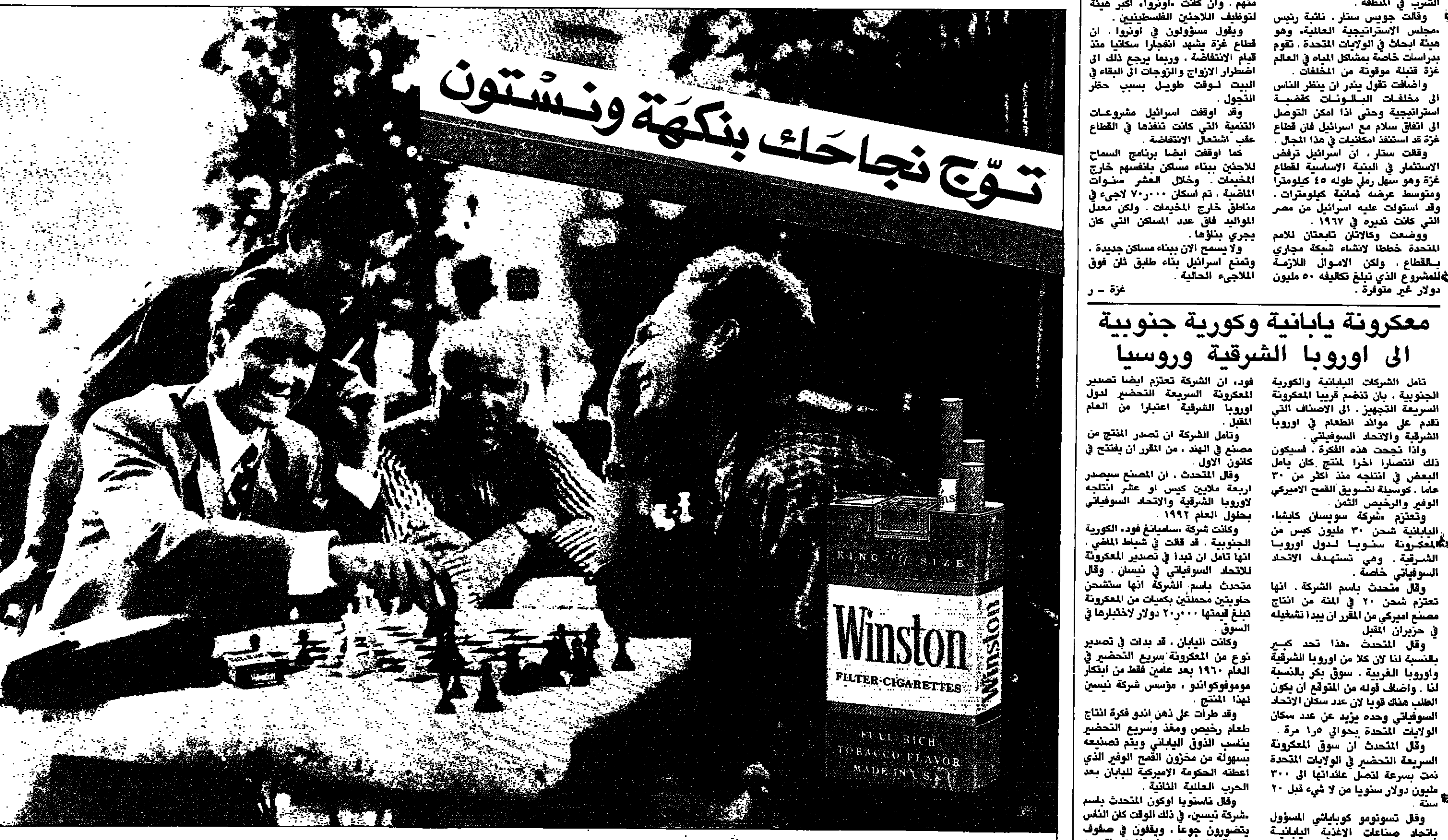
تعددير حكومي، التدخين يضر بصحتك وتصبحك بالامتناع منه

تأمل الشركات اليابانية والكورية الجنوبية، بان تنضم قريبا المكرونة السريعة التجهيز، الى الاصلاف التي تقدم على موائد الطعام في أوروبا الشرقية والاتحاد السوفياتي. وإذا نجحت هذه الفكرة، فسيعود ذلك انتصارا اخرًا لمنتج كان يامل البعض في انتاجه منذ اكثر من ٣٠ عاما، كوسيلة لتسويق الفصح الاميركي الوفير والرخيص الثمن. وتحتزم شركة سويسان كايشا، اليابانية شحن ٣٠ مليون كيس من المكرونة سنويا لدول أوروبا الشرقية، وهي تستهدف الاتحاد السوفياتي خاصة. وقال المتحدث باسم الشركة، انها تعتزم شحن ٢٠ في المئة من انتاج مصنع اميركي من المقرر ان يبدأ تشغيله في حزيران المقبل. وقال المتحدث، هذا تحد كبير بالنسبة لنا لان كلا من أوروبا الشرقية وأوروبا الغربية، سوق بحر بالنسبة لنا، واضاف قوله ان المتوقع ان يكون الطلب هناك قويا لان عدد سكان الاتحاد السوفياتي وحده يزيد عن عدد سكان الولايات المتحدة بحوالي ثرا مرة. وقال المتحدث ان سوق المكرونة السريعة التجهيز في الولايات المتحدة نمت بسرعة لتصل عائداتها الى ٣٠٠ مليون دولار سنويا من لا شيء قبل ٢٠ سنة. وقال تسونومو كوياباني المسؤول بتاحد صناعات الاغذية اليابانية السريعة التجهيز اصحتت المكرونة السريعة التجهيز شهر طعام ياباني في العالم. وتظهر ارقام الاتحاد، ان حوالي ١٣ مليار كيس من هذا النوع من المكرونة يباع سنويا في ٨٠ دولة. وقال المتحدث باسم شركة بنيسين، طوكيو - ر